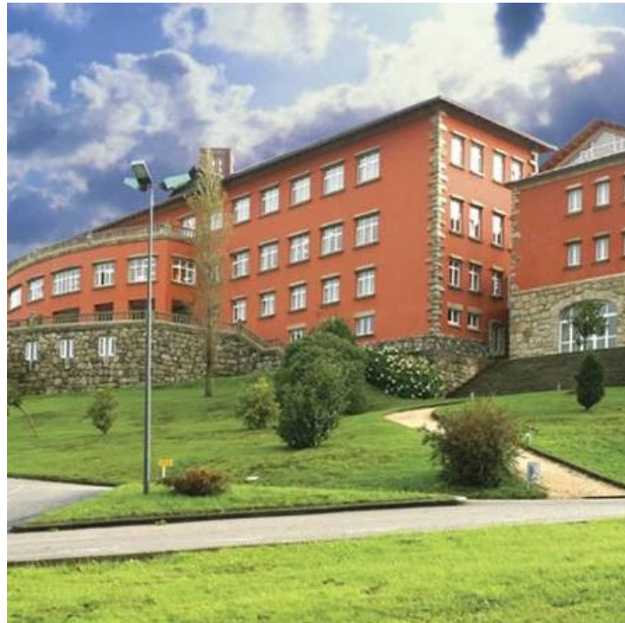
El Centro Nacional de Formación Marítima de Bamio del ISM.

Así pues, con la reciente reforma legislativa,